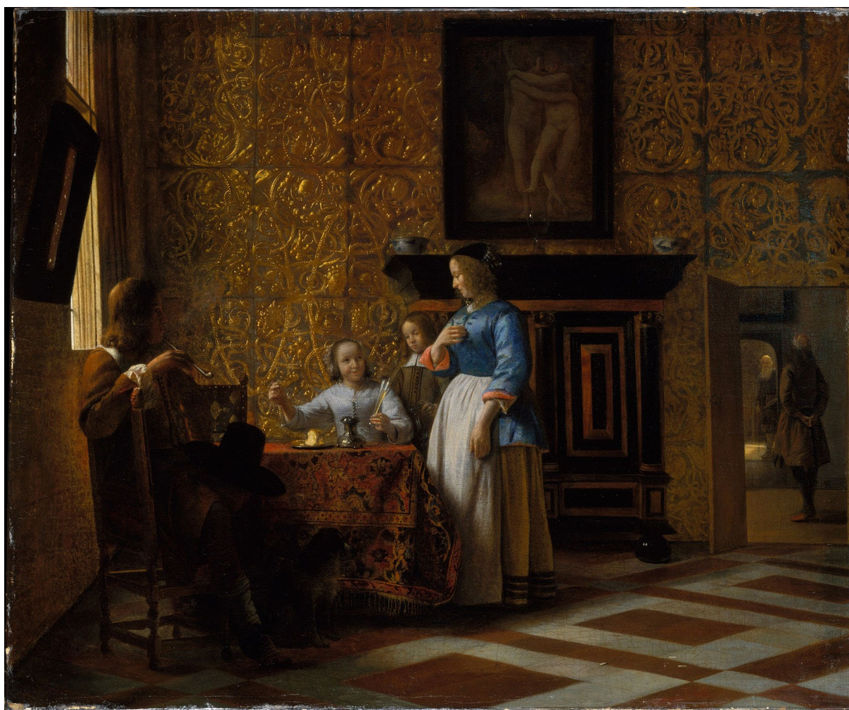
Kuva 3. Pieter de Hooch: Sisätila ja henkilöitä (1663-65)

Olohuone on paitsi kodin oleskelutila, myös funktioltaan julkisempi tila kuin esimerkiksi keittiö tai makuuhuone. Kotiin tulevat vieraat kutsutaan yleensä viettämään aikaa juuri olohuoneeseen. Se on myös neutraali tila, jossa perheenjäsenet voivat tavata toisiaan ja keskustella perheen asioista. Aikaisempina vuosikymmeninä television katseleminen kokosi perheenjäsenet yhteen useimmiten juuri olohuoneeseen, ja useimmissa perheissä Suomessa on varmasti yhä vieläkin televisio sijoitettuna olohuoneen keskeiselle seinälle. Nykymaailmassa tosin perheiden yhteinen televisioaika on pienentynyt sitä mukaa, kun lapset, nuoret ja aikuiset ovat siirtyneet katselemaan tai pelaamaan omia mediasisältöjään tietokoneiden, älypuhelimien ja tablettien ruuduilta.