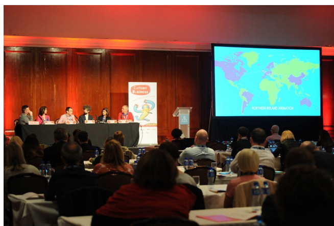
Kuva 2. Cartoon Business -tapahtuma 2017

Itse olen viime vuosina osallistunut - sekä opiskelijoiden kanssa että itsekseni - muutamiin kansainvälisiin animaatio- ja pelialan seminaareihin ja tapahtumiin. Muun muassa belgialainen Cartoon-järjestö on erikoistunut animaatioalan koulutustapahtumiin. Esimerkiksi Cartoonin vuosittain järjestämä Cartoon Business -seminaari kestää kolme päivää, jona aikana kaikki osallistujat majoitetaan samaan hotelliin, ja heille järjestetään myös yhteiset lounaat ja yhteiset iltaohjelmat. Ranskalais-belgialaiseen tapaan luentoja, esityksiä ja paneelikeskusteluja on päivittäin klo 9-18, josta lounaalle on varattu aikaa puolitoista tuntia. Jos joku osallistuja painuisi opinto- ja informaatio -osuuden jälkeen koko loppuil-laksi hotellihuoneeseensa tai päättäisi tehdä jotain muuta kuin toiset, häntä pidettäisiin vähintään merkillisenä. Tosin olen havainnut, että näissä sosiaalisissa iltatapahtumissakin on aina muutamia 'yksinäisiä susia', jotka seisovat nurkissa viinilasi yhdessä ja kännykkä toisessa kädessään, kommunikoimatta kenenkään kanssa.