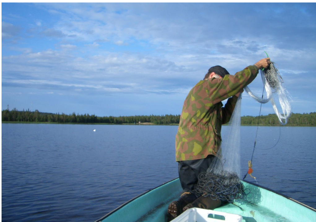
Kuva 10. Kalastaja Koulujärvellä

kiertelisin järven rantoja ja koettaisin löytää onkipaikkoja, joista nousee kalaa. Kuten onkimisessa on oltava oikeaan vuorokaudenaikaan liikkeellä, myös avoimissa ja täydentävissä koulutuksissa on osuttava oikeaan aikaan vuotta, jotta pääsisi kursseille mukaan. Ja kuten avannosta pilkkiessä ei koskaan voi tarkkaan tietää, mitä kaloja järvestä kulloinkin nousee, ei avoimen yliopiston sivuiltakaan voi yleensä ennakolta tietää, mitä kursseja siellä milloinkin on tarjolla. Jos edellisenä vuonna on ollut esimerkiksi kiinan alkeita tarjolla, voi olla ettei sitä olekaan enää seuraavana syksynä saatavilla.