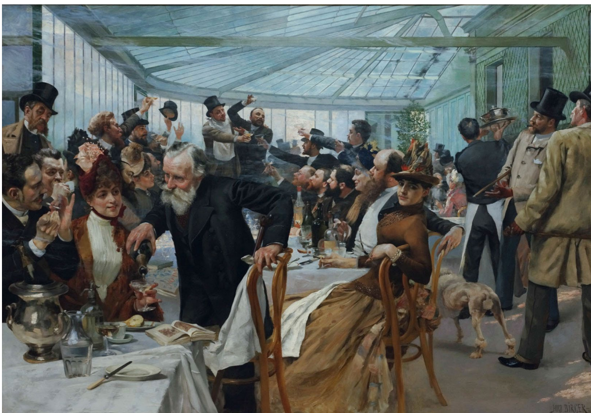
Kuva 8. Hugo Birger: Scandinavian Artists at Breakfast in Café Ledoyen on the day of the Paris Salon's opening in 1886

Kun tee, kaakao ja kahvi yleistyivät Euroopassa Uuden ajan alussa, mantereen ns. sivistyskaupunkeihin perustettiin salonkeja, joissa näitä uusia nautintojuomia sai nauttia. Salonkeja ylläpitivät aluksi varakkaat rouvat tai leskirouvat, ja niissä myös järjestettiin musiikkiesityksiä, kirjailijat ja runoilijat lukivat teoksiaan ääneen, tutkijat kertoivat löydök-