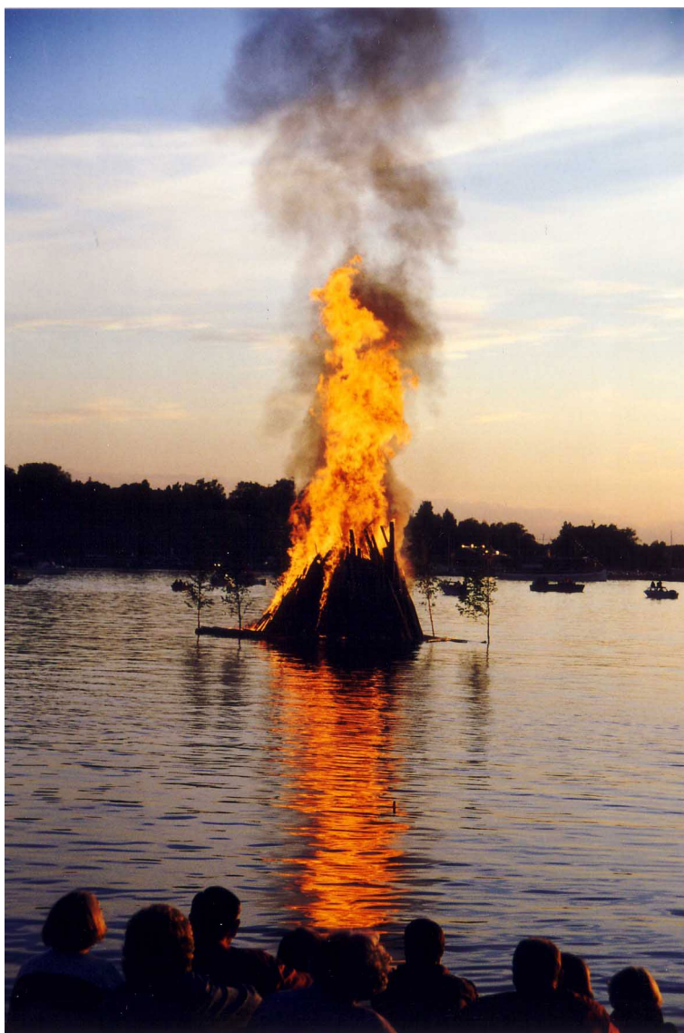
Kuva 4. Juhannuskokko

Kun useimmat muut eläimet vaistomaisesti pakenevat tulta, me ihmiset olemme siitä merkillisiä, että pakenemisen sijaan hakeudummekin tulen ääreen. Tuli on meille sekä turva, työväline että ase. Kreikkalaisissa taruissa tuli oli alun perin jumalten salaisuus, jonka Prometheus varasti ja antoi ihmiskunnalle. Tuli - hallittuna, kuten nuotiossa - luo meissä vahvoja mielikuvia sekä tiedosta, turvasta että sosiaalisuudesta. Ja niin kuin nuotiosta voi syttyä laaja metsäpalo, myös tiedon jakamisesta on syntynyt vallankumouksia.