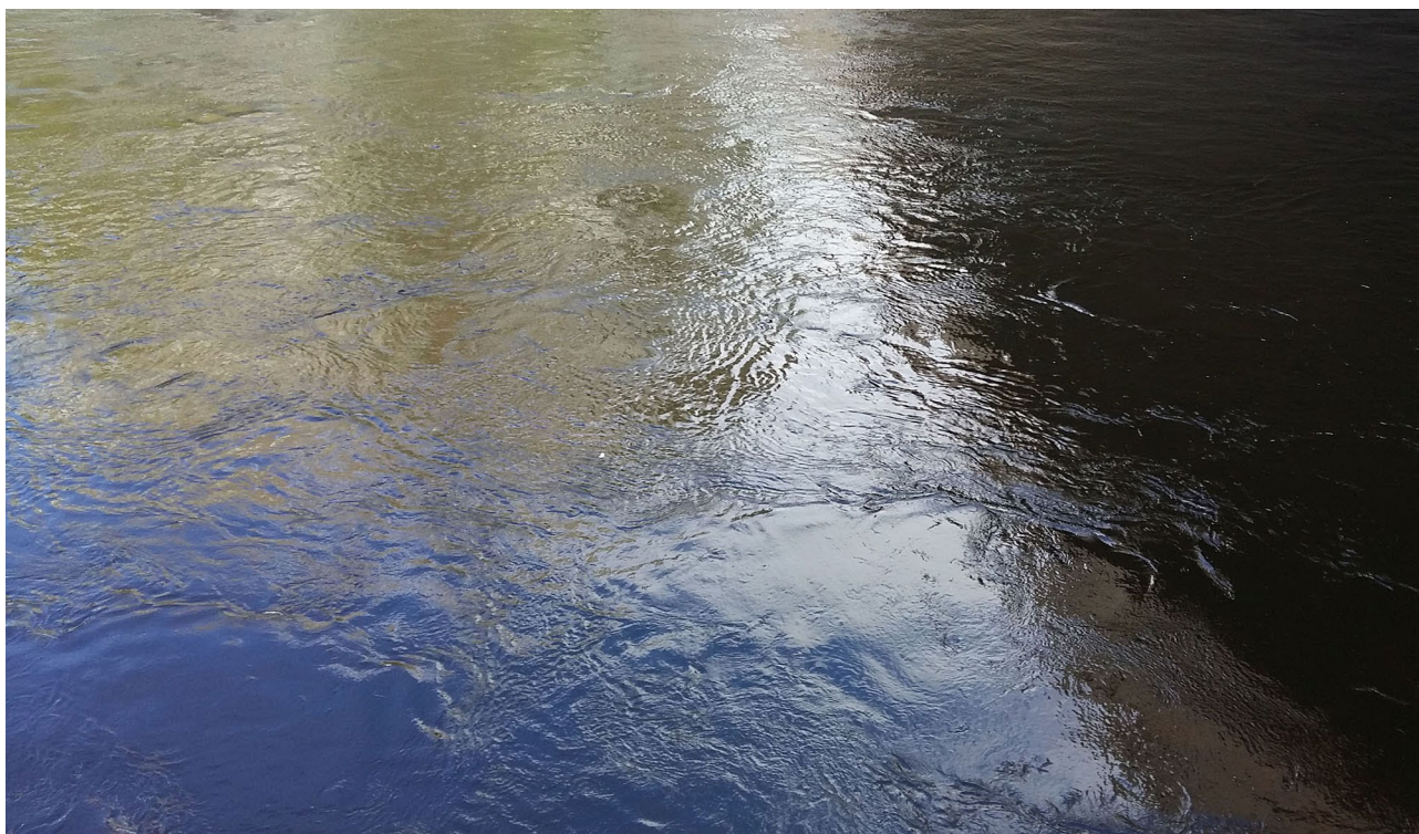
Kuva 13. Tammerkoski

Millainen on Tampereen uuden yliopiston brandi tai brändi? Todennäköistä on, että täydennyskoulutusten ja avoimen yliopiston tarjonnan on noudatettava koko yrityksen linjaa, mutta mikä se on? Oli miten oli, voisiko aikaisemmin mainituista kymmenestä analogiasta olla apua? Tampereen uusi yliopisto sijaitsee keskellä Pirkanmaata, järvien ympäröimässä kaupungissa, joten kalajärvi voisi kenties sopia. Tosin järvestä ei synny yhtä dynaamista mielikuvaa kuin vaikka merestä tai joesta, joissa vesi on jatkuvassa liikkeessä. Oletettavasti Tampereen uusi yliopisto haluaa nimensä mukaisesti pysyä uutena eli uudistua, kuten vesi joka kulkee Tammerkossessa. Entä koski?