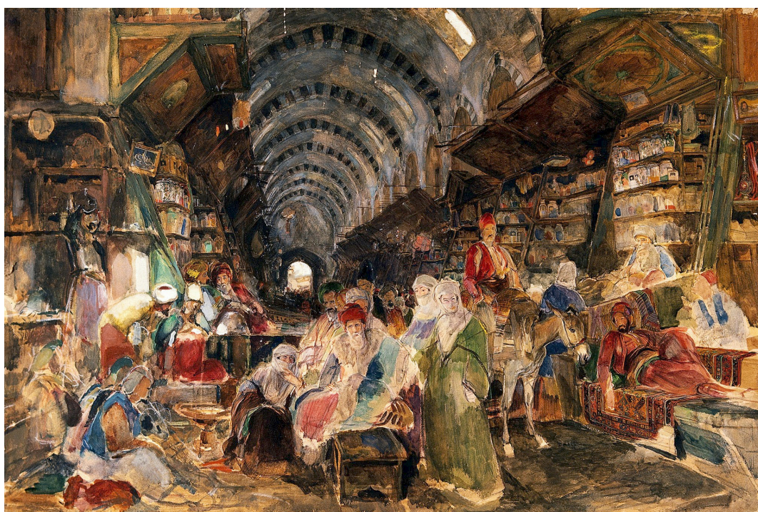
Kuva 7. J.F. Lewis: Konstantinopolin basaari, n. 1840

Kauppakeskukset, basaarit ja kauppahallit muistuttavat toreja siinä, että niissä ostetaan ja myydään kaikenlaista, ja ihmiset tapaavat siellä toisiaan myös muuten vain. Erona toreihin on, että ollaan sisätiloissa, ja tilat ovat usein rakenteeltaan mutkittelevia, jopa ahtaita. Nykyaikaiset kauppakeskukset poikkeavat basaareista ja kauppahalleista siinä, että tilat ovat avaria, ilmavia ja hyvin valaistuja, joskus huippuarkkitehtien suunnitteleimia, ja lattia- ja seinäpinnoissa on käytetty kalliita materiaaleja. Basaariin ja kauppahalliin - samoin kuin torille - saa yleensä astua kuka tahansa, mutta moderniin kauppakeskukseen pääsevät yleensä sisään vain ne, jotka näyttävät potentiaalisilta asiakkailta. Suomessa esimerkiksi nuorisojoukkoja tai juopuneita ei päästetä moniin kauppakeskuksiin tai tavarataloihin 'notkumaan' eli viettämään aikaa ostamatta mitään.