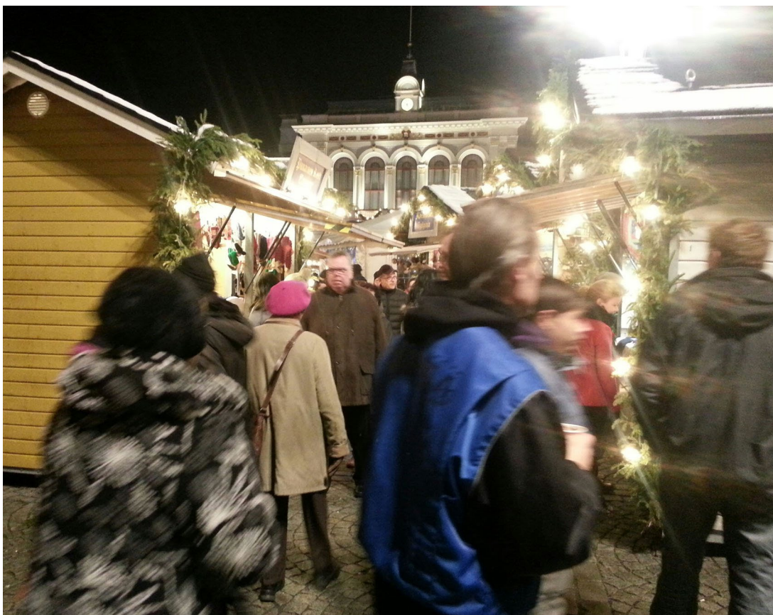
Kuva 6. Tampereen joulutori

Toreja - aukoita, jonne on säännöllisin väliajoin kerääntynyt tekemään kauppaa - on ollut ja on kaikissa kulttuureissa, lähes kaikkina aikoina. Torien ympärille on noussut Suomessa ja muuallakin kokonaisia kaupunkeja, joten toria voi kutsua monen kaupungin sydämeiksi. Torit ovat toimineet ja toimivat paitsi kauppapaikkona, myös kokoontumispaikkoina. Kun jotain suurta tapahtuu Suomessa - esimerkiksi urheilulajin MM-kisavoiton juhlinta, yleislakko, sodan alkaminen, itsenäisyysjuhla, presidentin hautajaiset, mielenosoitus tärkeänä pidetystä asiasta - ihmiset kokoontuvat joukolla pääkaupungin ja muiden suurehkojen kaupunkien toreille.