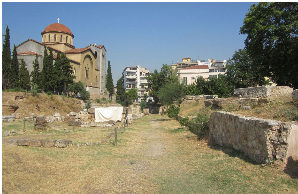
Kuva 1. Platonin akatemiaan vievä muinainen tie

Platonin Akatemia oli ensimmäisiä jossain määrin muodollisia oppilaitoksia maailmassa. Sen tarkoituksena oli antaa koulutuksen loppusalaus Ateenan vapaiden miesten (eli kaupunkivaltion ylemmän eliitin) pojille, jotta nämä voisivat osallistua täysivaltaisesti päätöksentekoon ja sotiin naapurivaltioita vastaan. Akatemian alueella oli kirjasto, kylpylä, juoksurata, urheilukenttä (jonne myös koottiin kaupungin sotajoukot ennen sotaan lähtemistä) sekä alkujaan pyhä lehto, jonka poluilla opiskelijaryhmät kulkivat opettajien kanssa keskustellen ja väitellen, oppien siis retoriikkaa ja filosofiaa. Tarkoituksena oli paitsi valmistaa nuorukaiset fyysisesti pystyviksi sotureiksi, myös ajattelukykyisiksi ihmisiksi, jotka tunsivat oman ryhmänsä ja heimonsa kulttuurin perin pohjin. Sosiaalisten siteiden luominenkin oli ensiarvoisen tärkeää, jotta nuoret miehet olisivat sekä yksilöitä että ryhmän aktiivisia jäseniä.