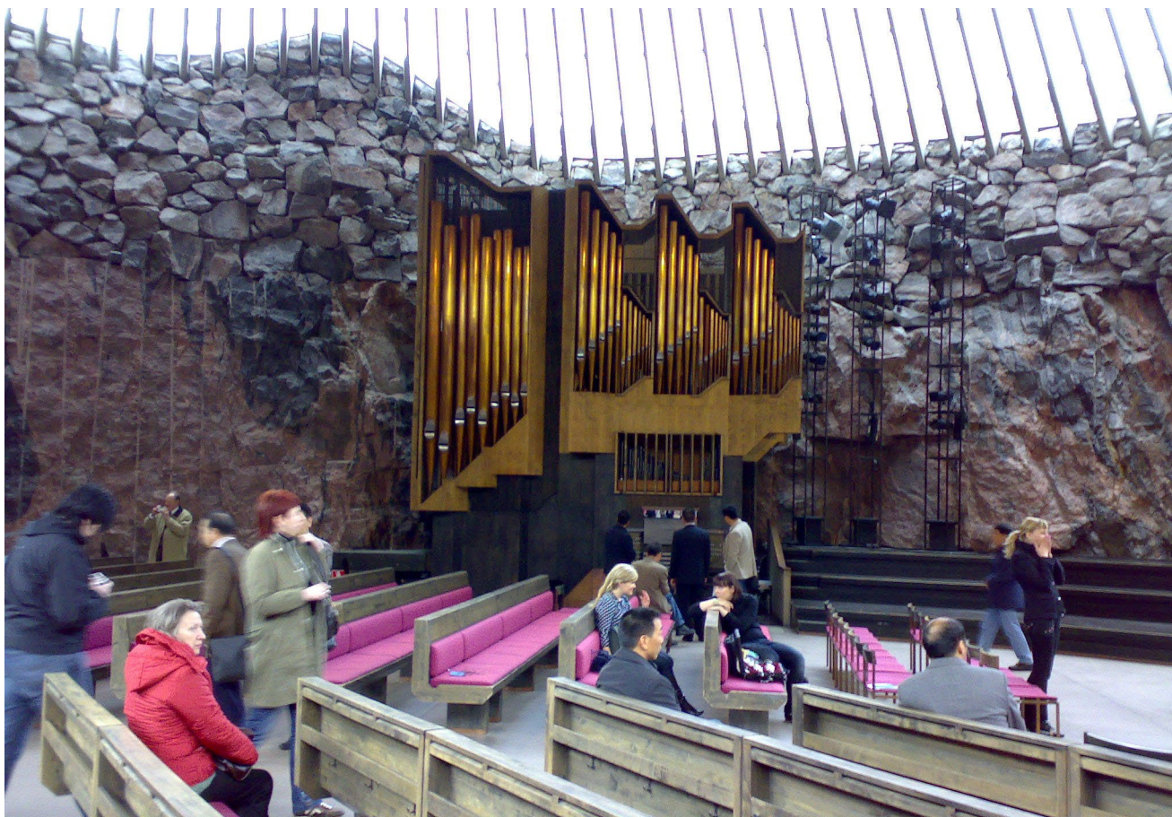
Kuva 9. Tempelaukion kirkko, Helsinki

Monikin on todennäköisesti kuullut kirjastoa tai oppilaitosta kuvattavan ’tiedon temppeleinä’. Mistä tämä metafora on saanut alkunsa?