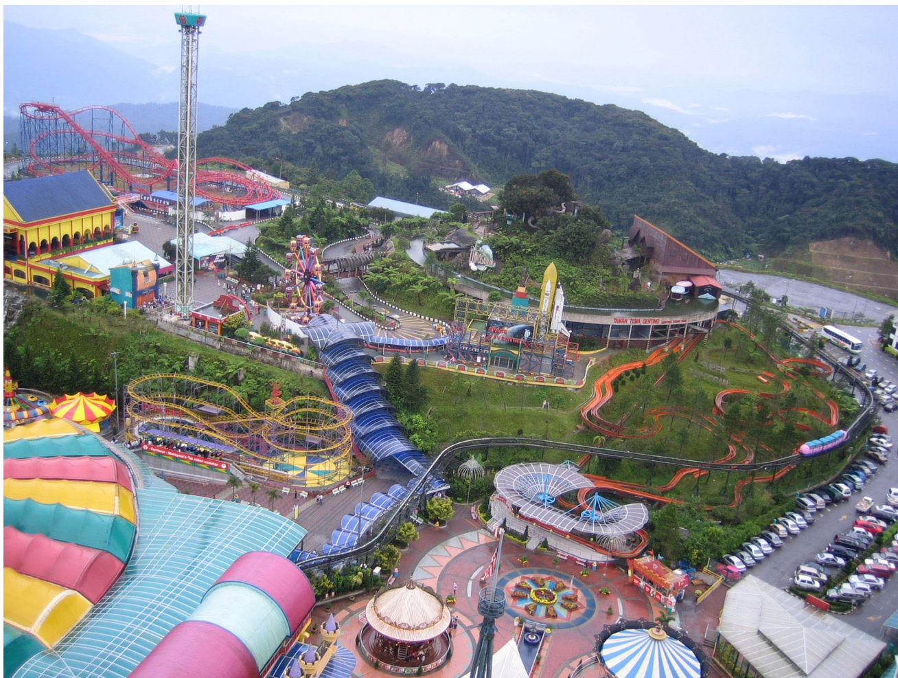
Kuva 5. Gentings Highlandin elämyspuisto

Huvipuistot ovat yleensä seikkailupuistoja suurempia ja niissä keskitytään vähemmän fyysiseen tekemiseen ja enemmän mekaniisiin laitteisiin, jotka liikuttavat kävijöitä eri tavoin. Lisäksi huvipuistot tarjoavat - yleensä maksua vastaan - pelejä, ruokaa sekä tanssi- ja teatteriesityksiä. Tampereella Särkänniemen huvipuistoon on yhdistetty myös näkötorni, planetaario, akvaario ja jopa nykytaiteen museo. Kolme viimeksimainittua tarjoavat ajanvietteen lisäksi myös tietoa, taide-elämyksiä ja oppimista. Tanskalaisen Legolandin pienoismallikaupunkeineen voisi myös lukea oppimista sisältäviin hui-/elämyspuistoihin.