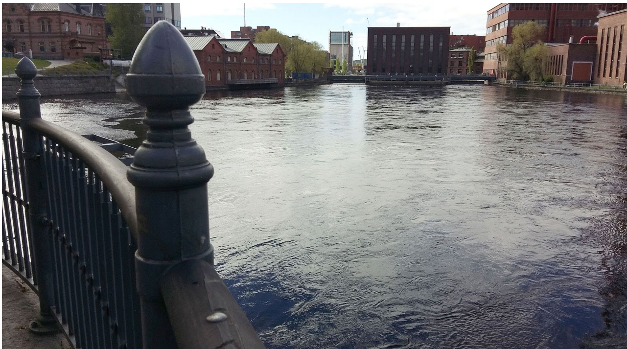
Kuva 14. Tammerkosken alajuoksua

kaiken aikaa muutoksessa ja liikkeessä oleva, siltikin tiettyyn suuntaan menevä, hieman ehkä samantyyppinen kuin Tampereen uuden yliopiston täydennyskoulutus?