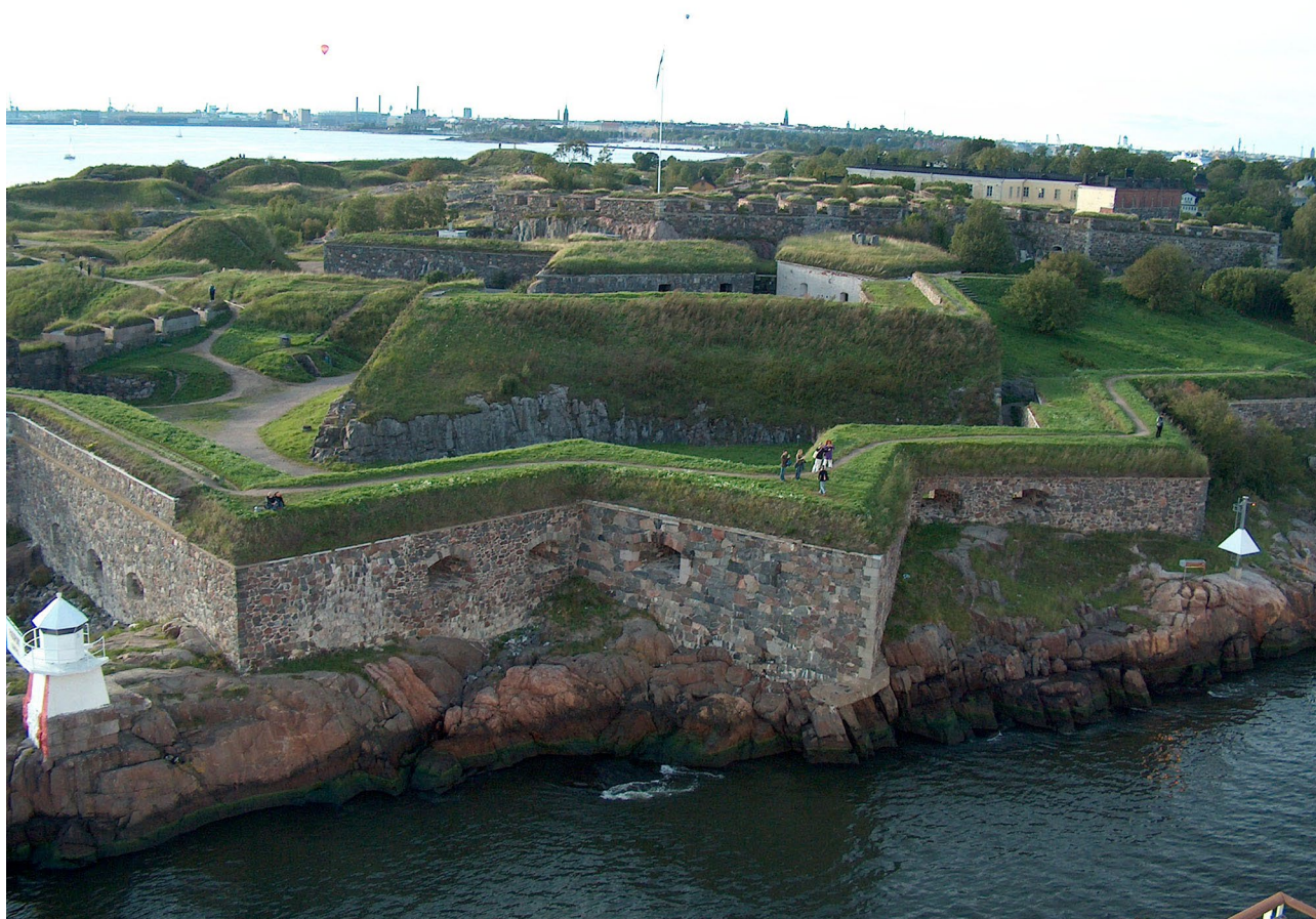
Kuva 11. Suomenlinna

Tiedon jakamisella on aina ollut myös strateginen merkitys. Esimerkiksi karttojen lukemisen taito ja karttojen saatavuus olivat keskiajalla ja renessanssin aikana varattu vain (ylemmille) sotilassäädyille ja kuninkaallisille. Kun Edward Snowden taannoin julkisti Yhdysvaltain tiedustelupalvelujen urkkimisen laajuuden koko maailmalle, hänestä tuli oitis vainottu ja petturina pidetty henkilö kotimaassaan. Toisaalta väärän tiedon levittäminen on sekin ollut vanhastaan strateginen keino sekä sodan että rauhan aikana. Ongelmia syntyykin, jos valtiojohtajakaan ei valisteta siitä, mikä tieto on oikeaa ja mikä väärää. (Elokuva Perikato kuvaa kiinnostavalla tavalla tilannetta, jossa valtion päämies ei saa oikeaa tietoa sodan etenemisestä, eikä osittain halua edes uskoa totuutta.)