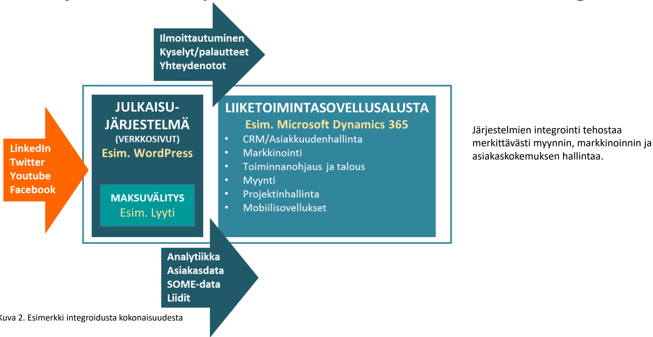
Kuva 2. Esimerkki integroidusta kokonaisuudesta